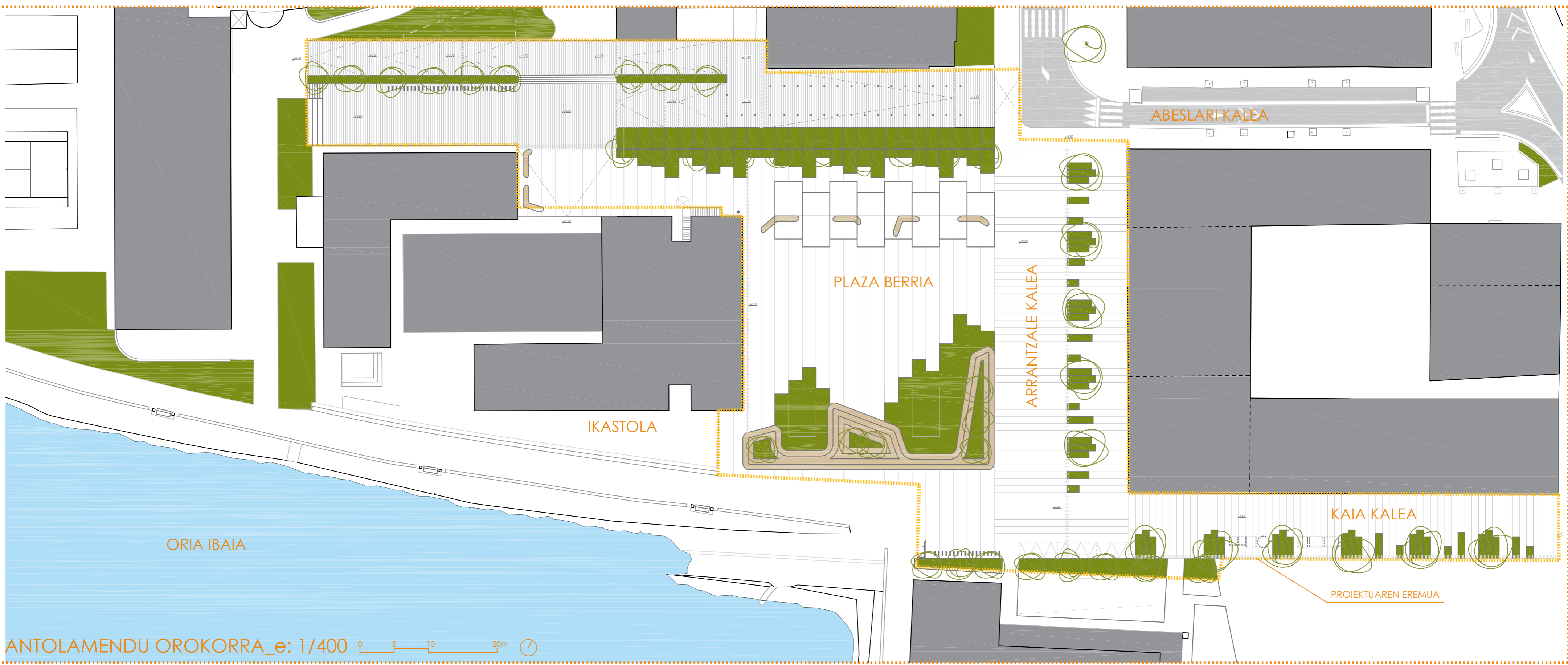
ANTOLAMENDU OROKORRA_e: 1/400